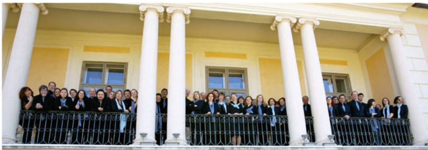
Der Grazer Chor „mondo musicale“ im Retzhof.